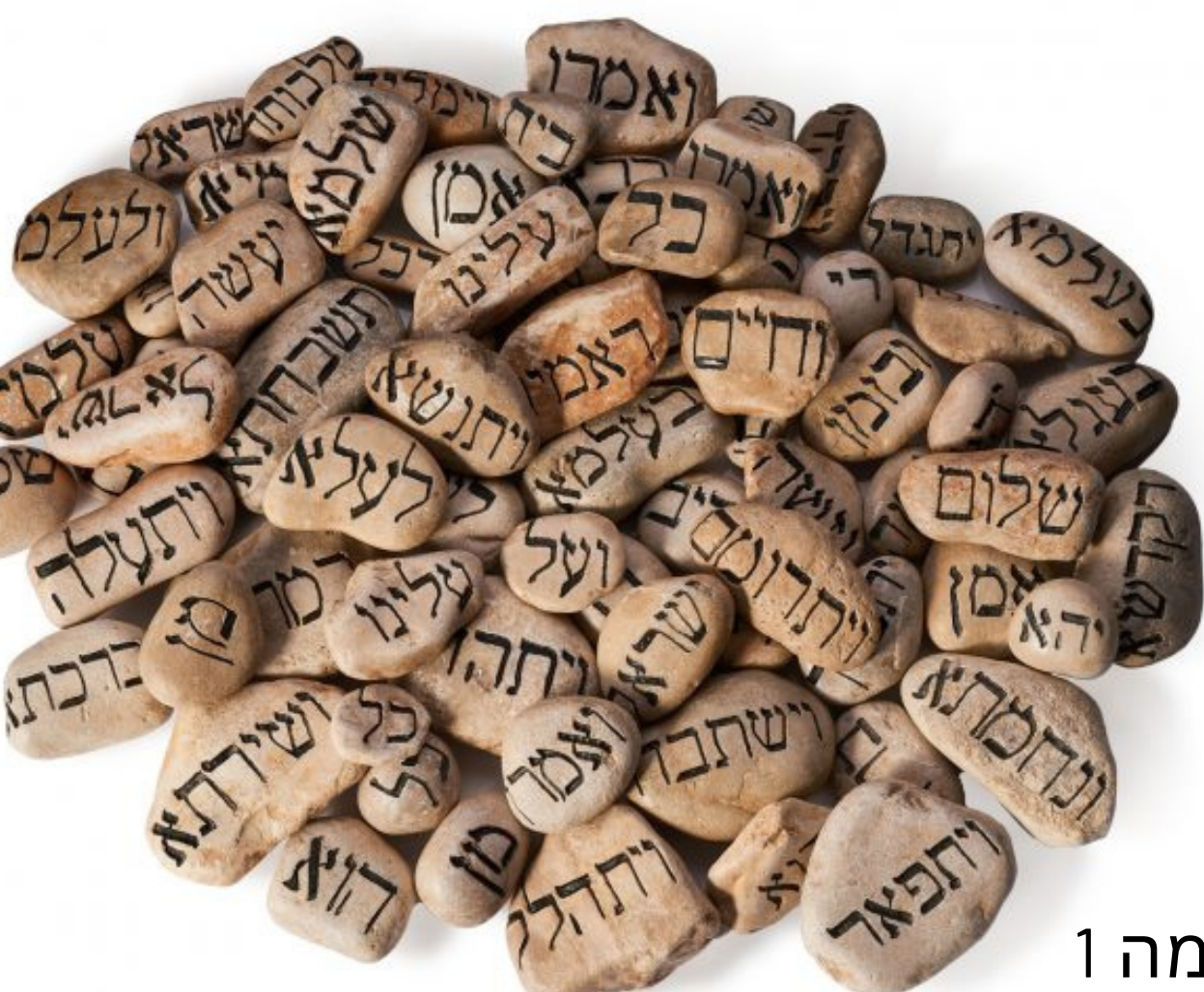
אבני קדיש, קומה 1